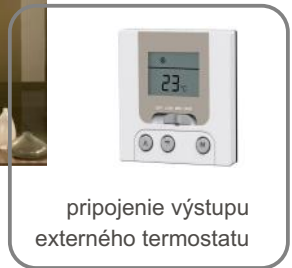
pripojenie výstupu externého termostatu