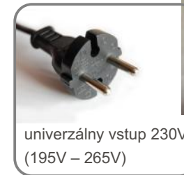
univerzálny vstup 230V (195V – 265V)